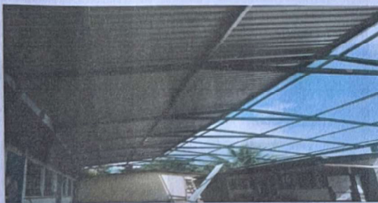
Foto 3: Suministro y sustitución de lámina acanalada por lámina troquelada calibre 26"