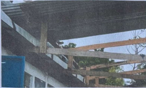
Foto 1: Suministro y sustitución de cimentación para estructura de techado