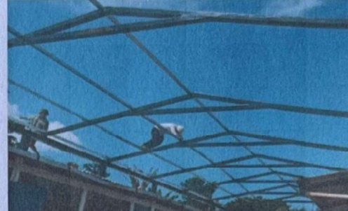
Foto 2: Suministro y sustitución de madera por estructura metálica para techado