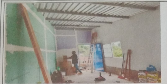
FOTO 1: VISTA FACHADA INTERIOR MATERIAL PREFABRICADO SEGUNDO NIVEL