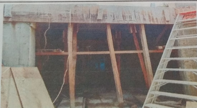
FOTO 5. INSTALACIÓN DE VIGAS