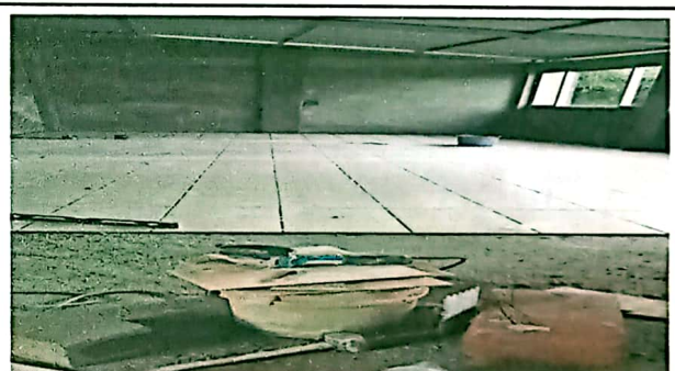
SUMINISTRO E INTALACIÓN DE PISO CERÁMICO

Observación: Si es necesario se pueden agregar hojas adicionales y actualizar el número de hojas.