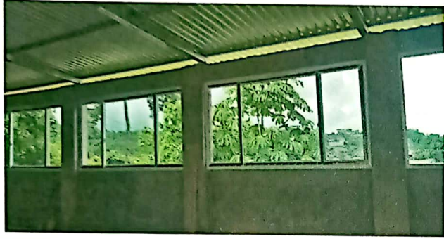
SOLERA FINAL E INSTALACIÓN DE VENTANAS PVC