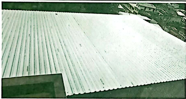
INSTALACIÓN DE ESTRUCTURA METÁLICA