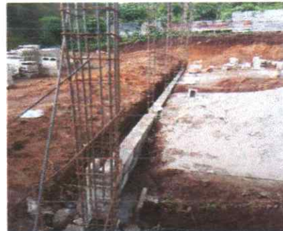
suministro e intalacion de piso para tres aulas de 4.96x 4.96

Observación: Si es necesario se pueden agregar hojas adicionales y actualizar el número de hojas.