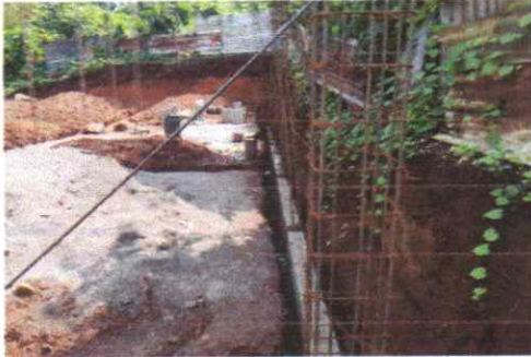
Suministro de block de 5.15 x 15.18 metros, Suministro e instalación de quintal de Hierro de 1/2 para terminación de soleras Grado 40