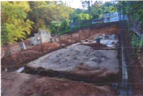
Suministro e instalación de techo de lamina Calibre 26 para 3 Aulas de 7.5 x 16 metros (120m 2 )