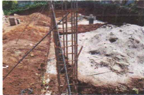
Suministro de block de 5.15 x 15.18 metros, Suministro e instalación de quintal de Hierro de 1/2 para terminación de soleras Grado 40