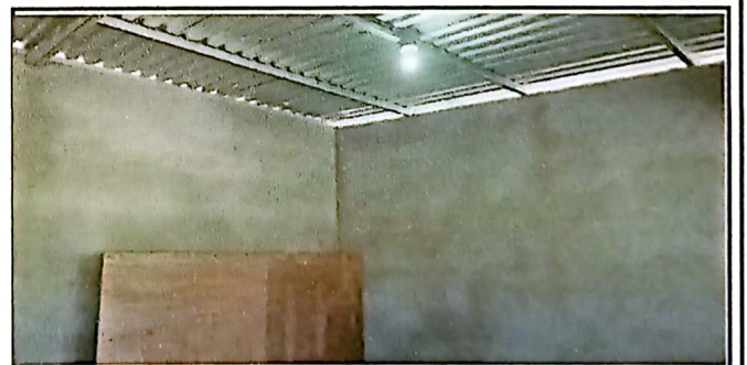
Foto 6: FINALIZA REMOZAMIENTO DE MUROS DE MODULO DE AULAS CON REPELLO

Observación: Si es necesario se pueden agregar hojas adicionales y actualizar el número de hojas.