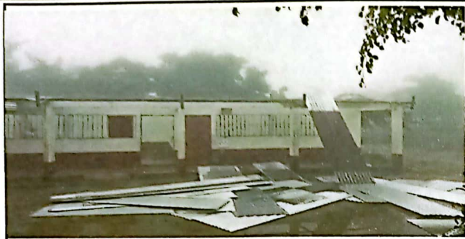
Foto1: RETIRO DE LÁMINAS ANTIGUAS