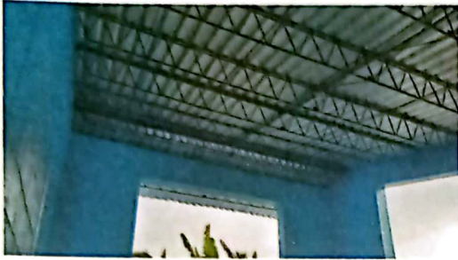
Foto1: VISTA DE FACHADA DEL TECHO LAMINA COLOCADA AL 100%