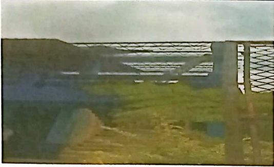
Foto1: RETIRO DE LÁMINAS ANTIGUAS