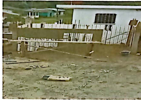
Foto 2: SUMINISTRO E INSTALACIÓN DE COCINA CON MATERIAL PREFABRICADO