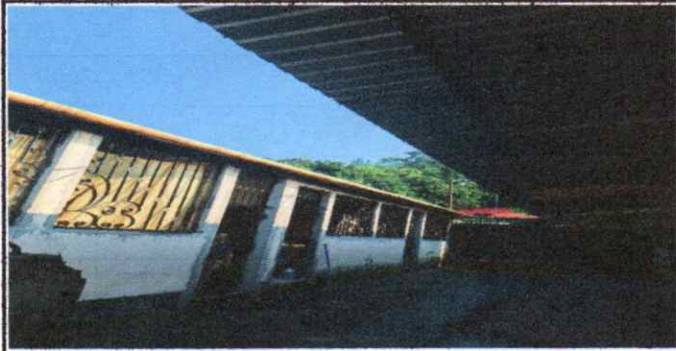
REMODELACION DE PASILLO