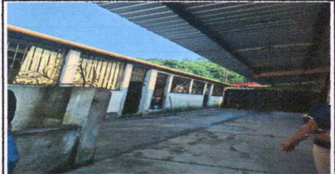
REMODELACION DE PASILLO