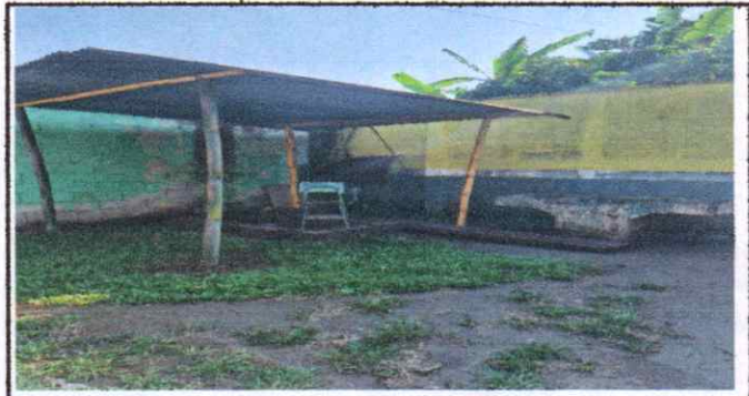
MANTENIMIENTO DE COCINA CON ... (COLOCAR QUE ELEMENTOS INCLUYE LA COCINA, MESA DE TRABAJO, PILA, LAVATRASTOS, ESTUFA, CHIMENEA)