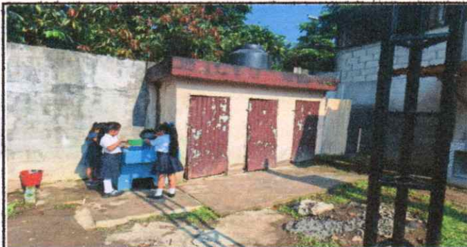
MANTENIMIENTO DE SANITARIO