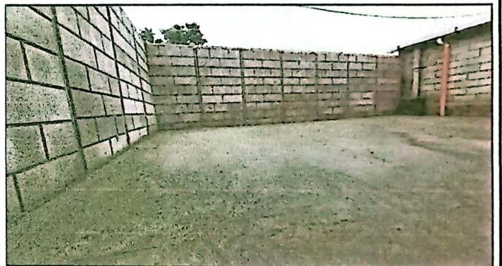
CORTE Y NIVELACION + FUNDICION DE MEZCLON DE CONCRETO