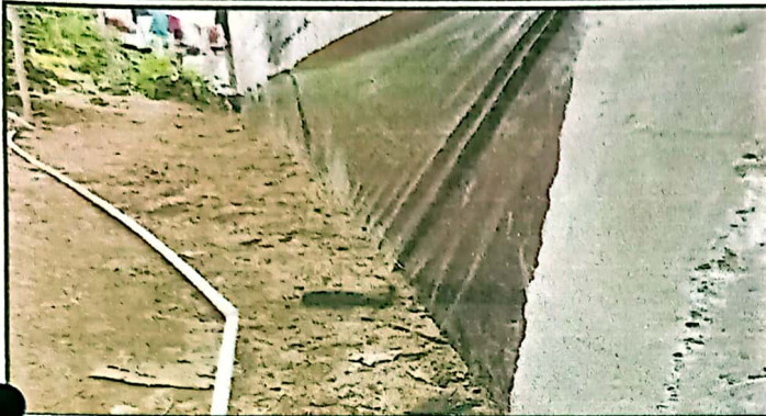
REMOZAMIENTO DE PARED COLINDANTE REPELLO + ALISADO + NYLON NEGRO