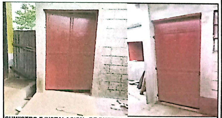
SUMINISTRO E INSTALACION DE PUERTA METALICA DE 2.27*1.08

Observación: Si es necesario se pueden agregar hojas adicionales y actualizar el número de hojas.