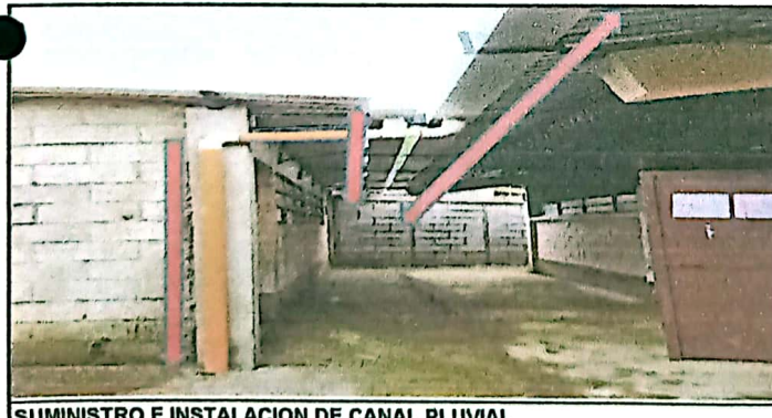
SUMINISTRO E INSTALACION DE CANAL PLUVIAL