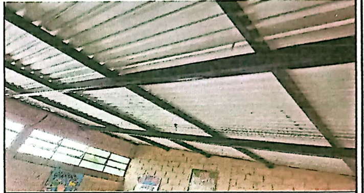
SUMINISTRO E INSTALACION DE CUBIERTA METALICA CON LAMINA TROQUELADA CALIBRE 26