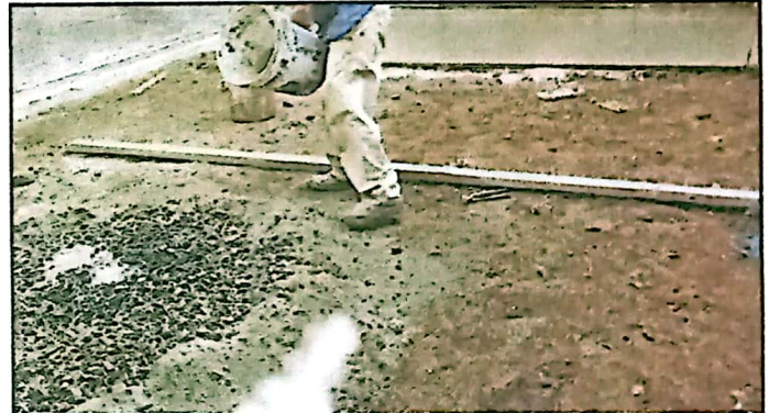
CORTE Y NIVELACION + FUNDICION DE MEZCLON DE CONCRETO