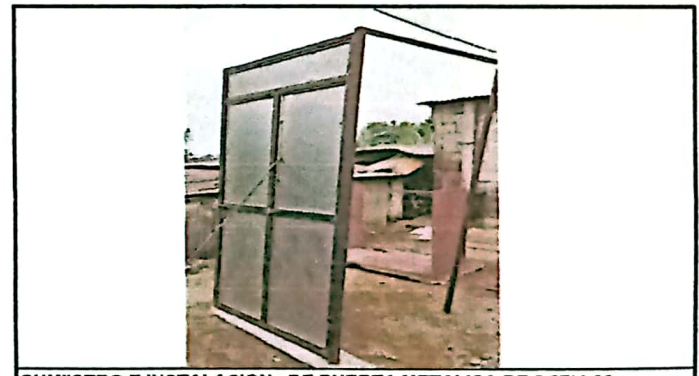
SUMIISTRO E INSTALACION DE PUERTA METALICA DE 2.27*1.06

Observación: Si es necesario se pueden agregar hojas adicionales y actualizar el número de hojas.