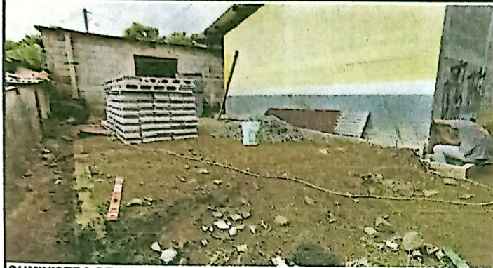
SUMINISTRO DE MATERIALES E INSTALACION DE MURO PREFABRICADO DE 12.35 ML * 2.80 M