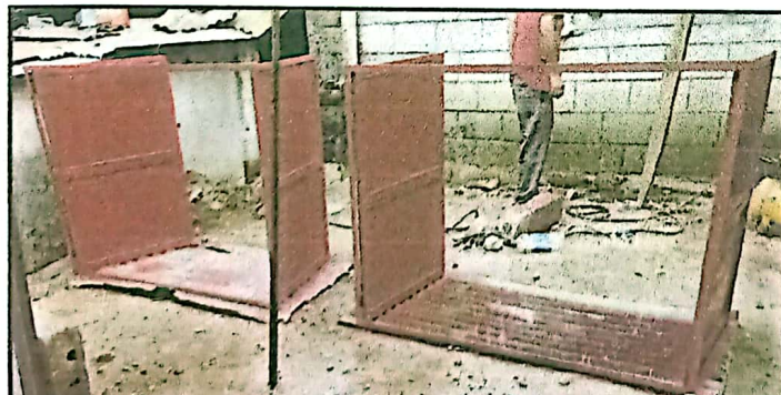
FABRICACION E INSTALACIÓN DE VENTANAS DE METAL, DE 1*1.50 CON PASADORES