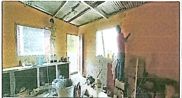
SUMINISTRO + APLICACIÓN DE PINTURA