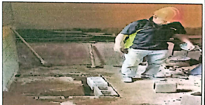
SUMINISTRO DE MATERIALES Y FABRICACIÓN DE ESTUFA, PILA Y MESA DE CONCRETO

Observación: Si es necesario se pueden agregar hojas adicionales y actualizar el número de hojas.