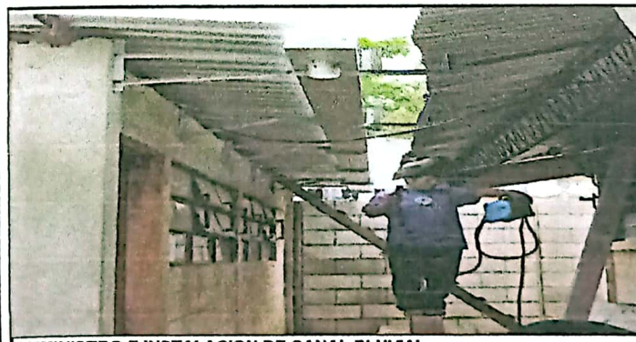
SUMINISTRO E INSTALACION DE CANAL PLUVIAL