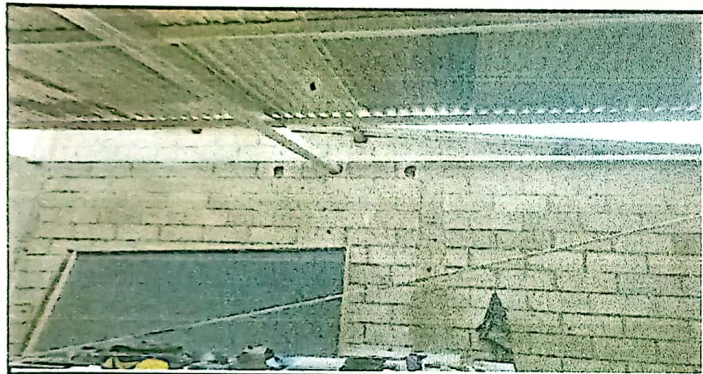
SUMINISTRO E INSTALACION DE ESTRUCTURA PORTANTE CON COSTANERA DE 3*2 GALVANIZADA