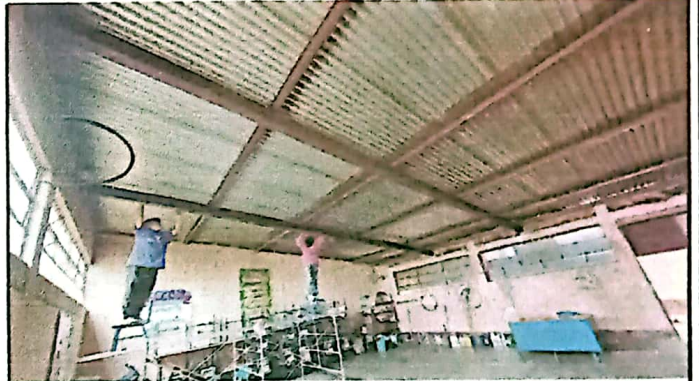
SUMINISTRO E INSTALACION DE CUBIERTA METALICA CON LAMINA TROQUELADA CALIBRE 26