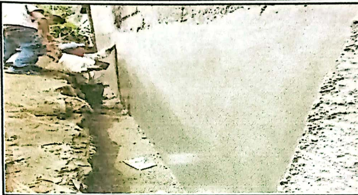
REMOZAMIENTO DE PARED COLINDANTE REPELLO + ALISADO + NYLON NEGRO