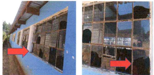
Sustitución de balcones y sustitución de vidrios de 5mm.

Observación: Si es necesario se pueden agregar hojas adicionales y actualizar el número de hojas.