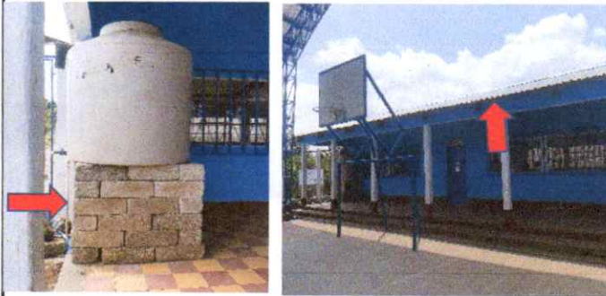
Sustitución de soporte de blok por metal galvanizado de deposito de agua 1000 y sustitución de bajada de agua pluvial