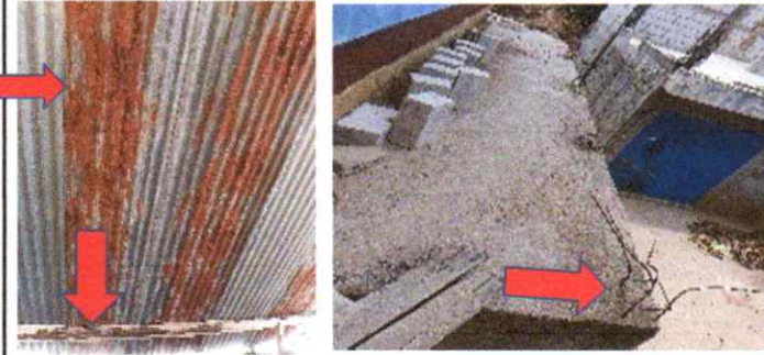
Sustitución de estructura de soporte de madera por metal, sustitución de lamina por lamina troquelada calibre 26, Y mantenimiento de baranda de concreto por metal