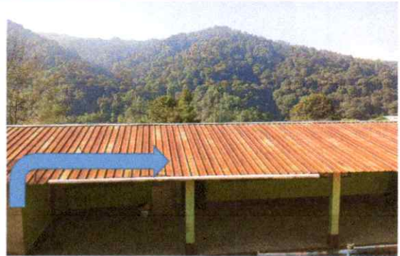
Techo No.2: 18 metros de largo por 10 metros de ancho. Consiste en cambio de lamina y pintadas de vigas y costaneras de metal