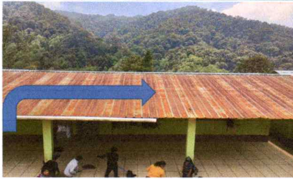
Techo No.1: De 22 metros de largo por 10 metros de ancho. Consiste en cambio de lamina y pintada de vigas de madera