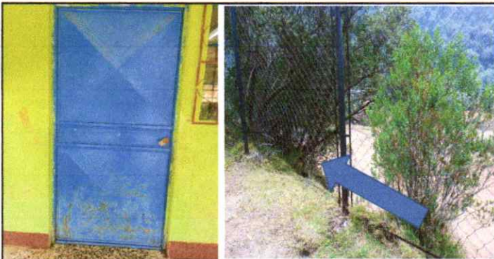
Pintada de 11 puertas de metal, Reparación de 14 metros de maya metálica