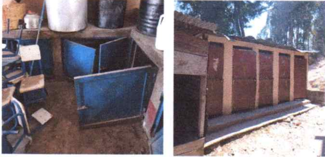
Sustitución de puertas