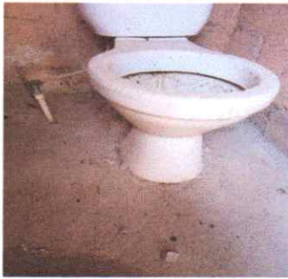
Suministro e instalación de repellos e impermeabilizante