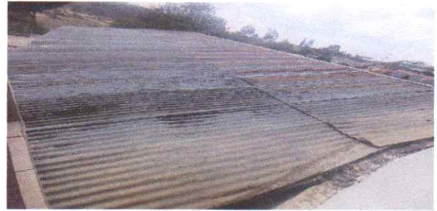
Sustitución de inodoros