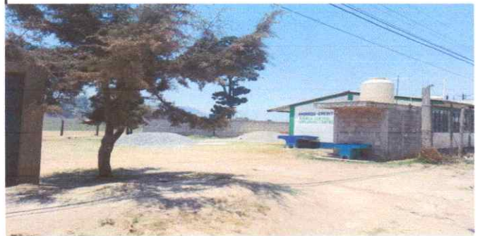
Instalación de muro perimetral con material prefabricado