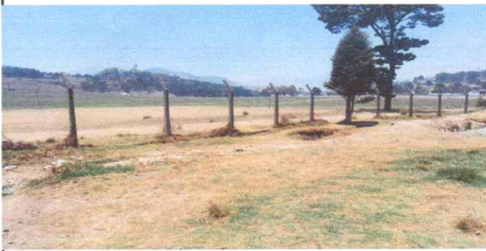
Instalación de muro perimetral con material prefabricado