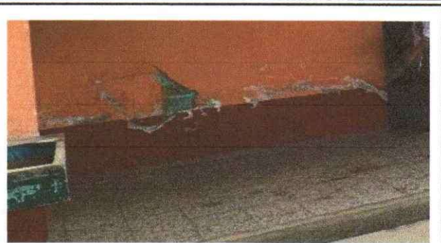
Resane de repello de muros