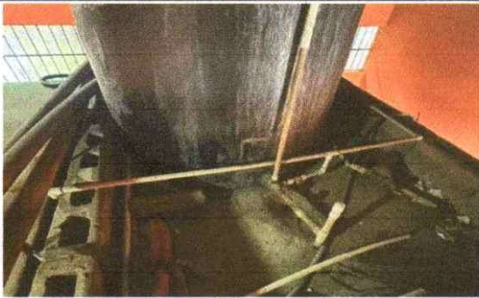
Mantenimiento a línea de distribución de agua potable