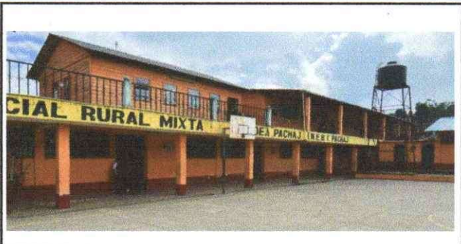
Aplicación de pintura Latex