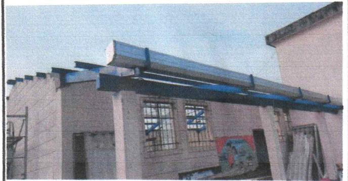
Instalación de canales y bajadas de agua

Observación: Si es necesario se pueden agregar hojas adicionales y actualizar el número de hojas.