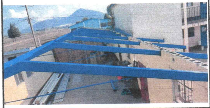
Cambio de estructura portante