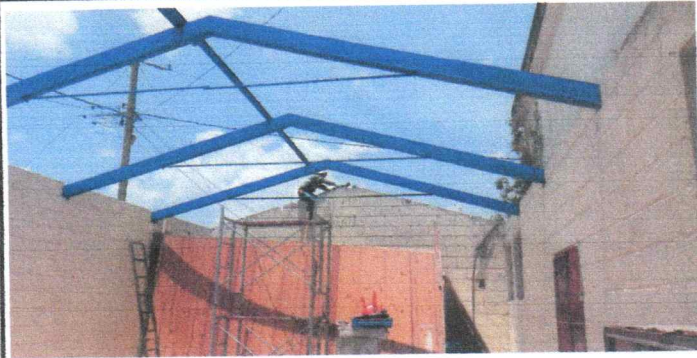
Cambio de estructura portante