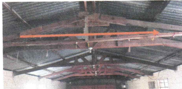
Sustitucion de estructura portante de madera a metal