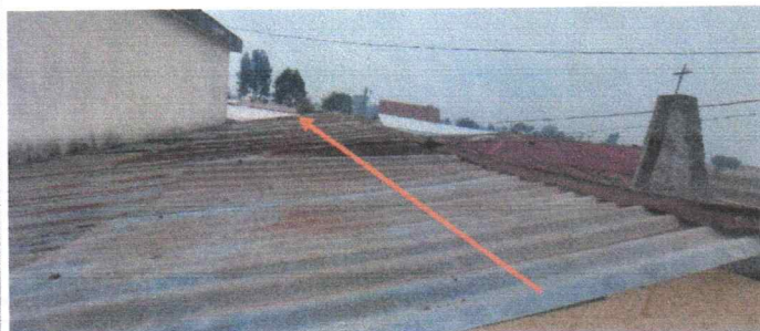
Sustitucion de lamina troquelada calibre 26