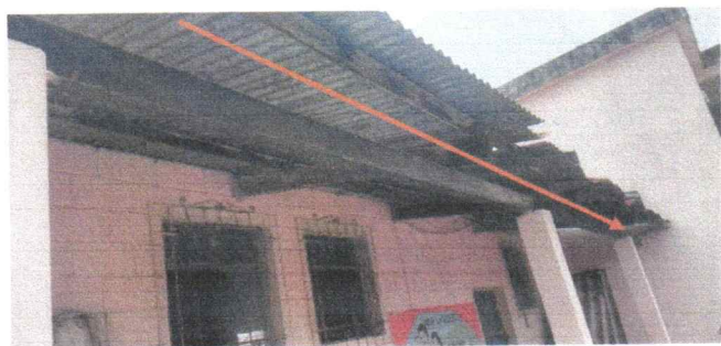
Sustitucion de lamina troquelada calibre 26