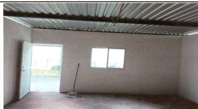
Foto 2: Describir la actividad de la fotografía: En esta fotografía se aprecia el terminado de pared, puerta de metal y ventana de PVC, corredizo con mosquitero.