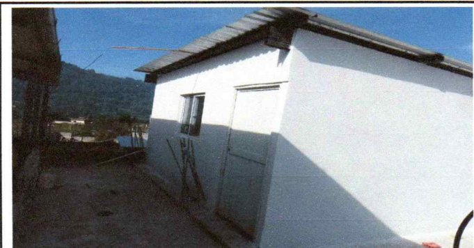
Foto 6: Describir la actividad de la fotografía: En esta fotografía se aprecia la parte frontal del proyecto terminnado.

Observación: Si es necesario se pueden agregar hojas adicionales y actualizar el número de hojas.