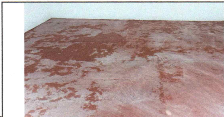
Foto 1: Describir la actividad de la fotografía: Esta fotografía indica la clase de piso, en este caso es un alizado en color teja lavable y apto para encerado.