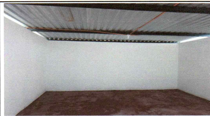
Foto 4: Describir la actividad de la fotografía: en esta fotografía se visualiza el perfil completo de paredes techo y piso, ya descritos en las anteriores fotografías.