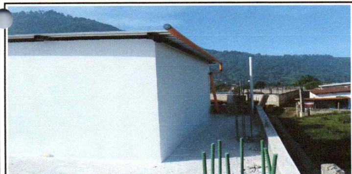
Foto 5: Describir la actividad de la fotografía: En esta fotografía se puede visualizar la parte posterior de la construcción terminada con acabado en repello con acabado de monocapa.