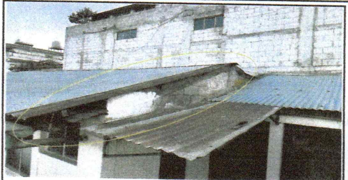
Sustitucion de estructura portante de madera a metal