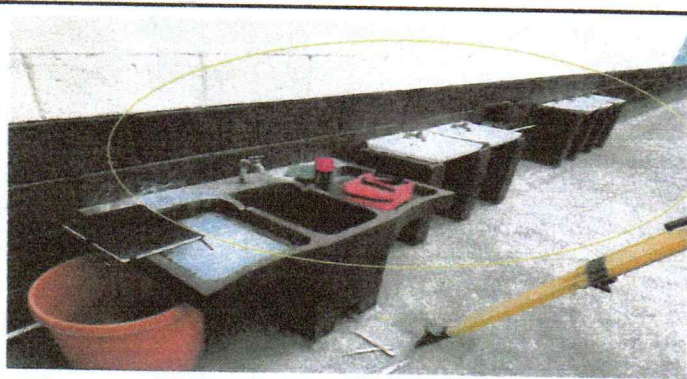
Mantenimiento de sistema de agua potable