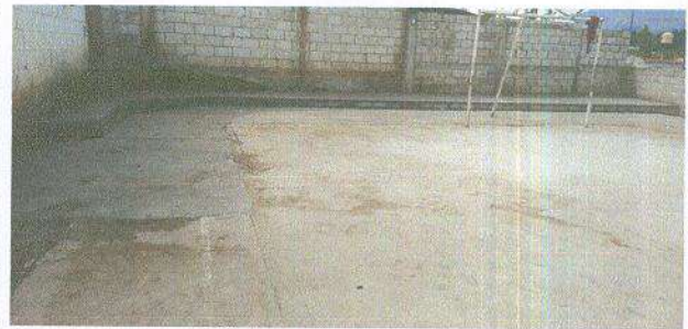
Sustitución de piso de concreto

Observación: Si es necesario se pueden agregar hojas adicionales y actualizar el número de hojas.