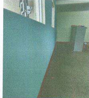
Aplicación de pintura an interiores de aulas