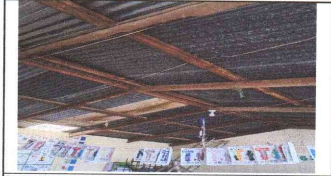
Sustitución de lamina troquelada calibre 26