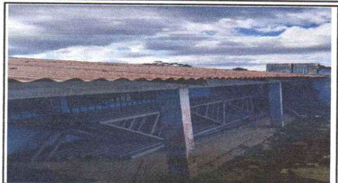
Sustitución de lamina troquelada calibre 26