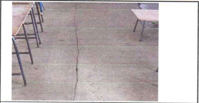
sustitución y colocación de piso granito