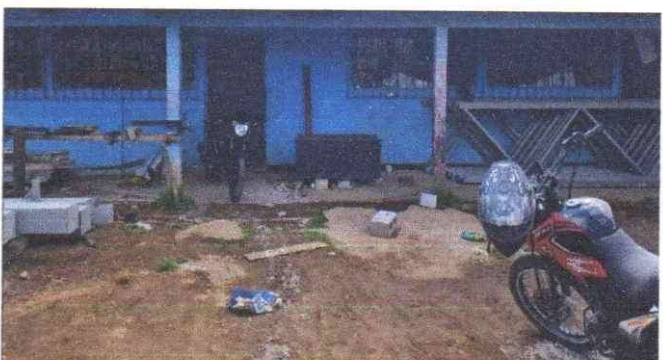
Sustitución de piso granito