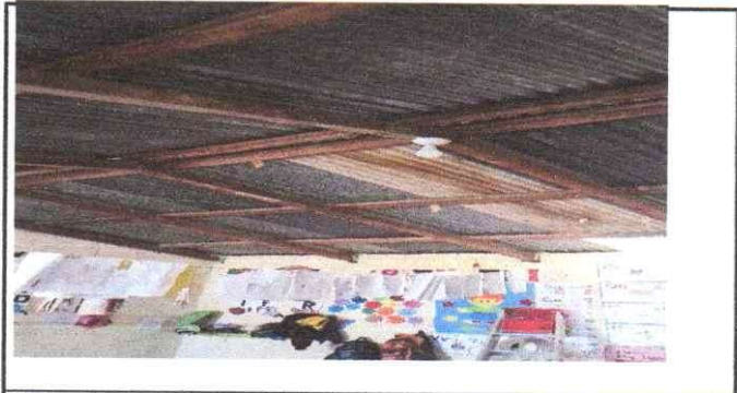
Sustitución de lamina troquelada calibre 26