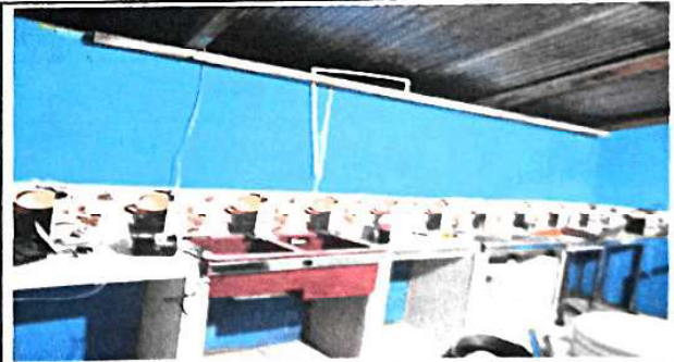
Foto 4: proceso de colocación de azulejo y piso cerámico de cocina.