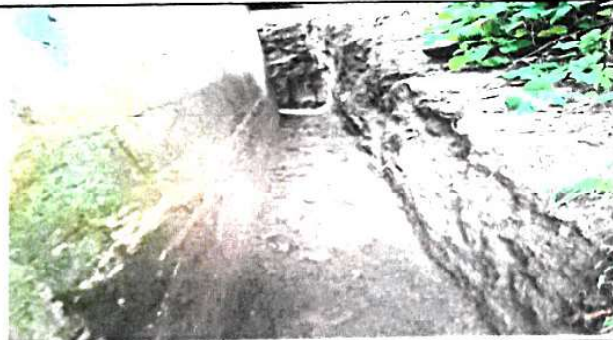
Foto 3: Limpieza de la pared para la colocación de impermeabilizante.