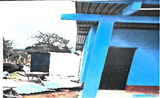
Foto 2: Proceso de reparación de muros divisorios de sanitarios.