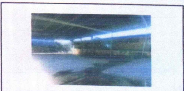
Foto 6: Interior del patio ya enluchado, con la tubería de bajada de agua.

Observación: Si es necesario se pueden agregar hojas adicionales. Máximo de 5 hojas.