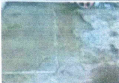
Reparación de planchas de concreto de patio