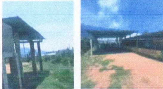
Sustitución de estructura de soporte metal,

Observación: Si es necesario se pueden agregar hojas adicionales al número de hojas.