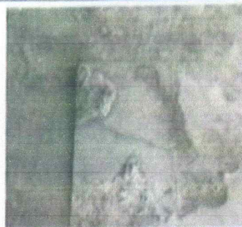
Reparación de planchas de concreto de patio