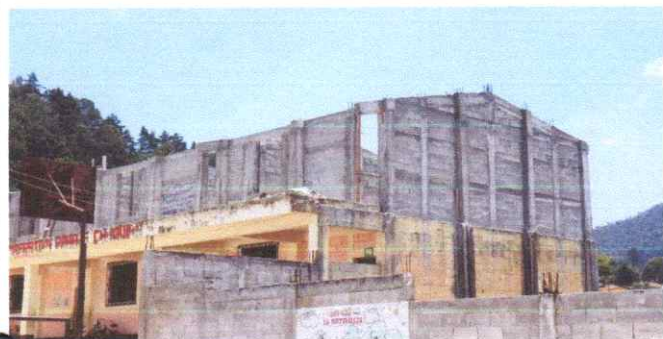
Suministro e instalacion de estructura portante de metal, suministro e instalacion de canales de agua pluvial