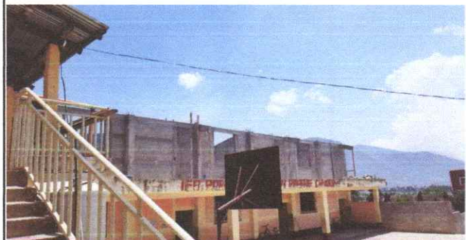
Suministro e instalacion de estructura portante de metal

Observación: Si es necesario se pueden agregar hojas adicionales y actualizar el número de hojas.