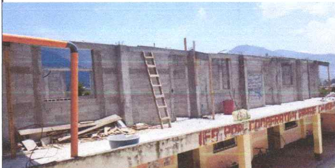
Suministro e instalacion de estructura portante de metal, suministro e instalacion de canales de agua pluvial