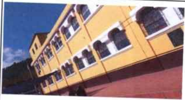
Foto1: suministro aplicación de pintura en muros exteriores e interiores