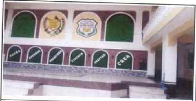
Foto 2: Sustitución de muro divisorio de material de tablayeso por fachal fachaleta

Observación: Si es necesario se pueden hacer fotos adicionales y adjuntar al número de hojas.