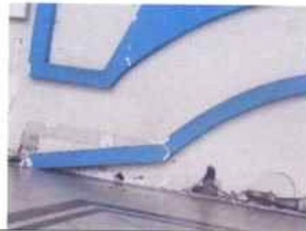
Sustitución de muro divisorio de material de tablayeso por fachal fachaleta

Observación: Si es necesario se pueden agregar hojas adicionales y actualizar el número de hojas.