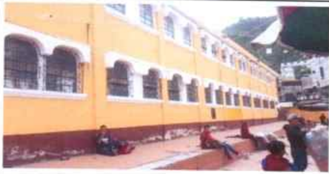
Suministro aplicación de pintura en muros exteriores e interiores