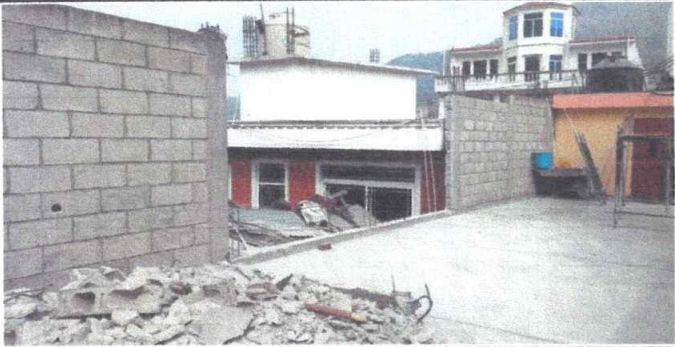
Foto1: Demolición de pared dañada