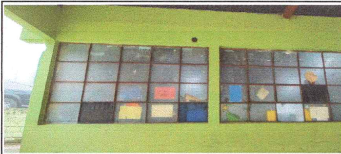
Suministro y fabricación de ventanas de metal incluye vidrios