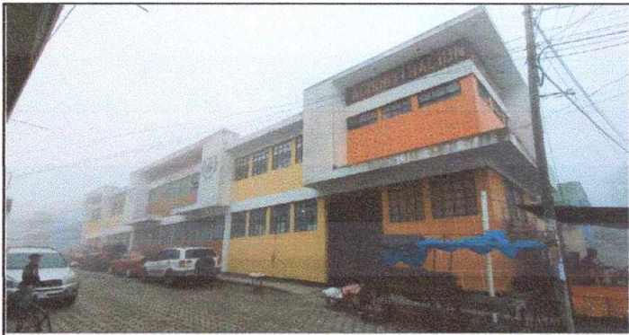
Suministro y aplicación de dos capas de pintura exterior