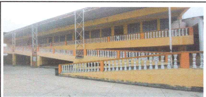
Remozamiento de estructura de soporte y pasamanos