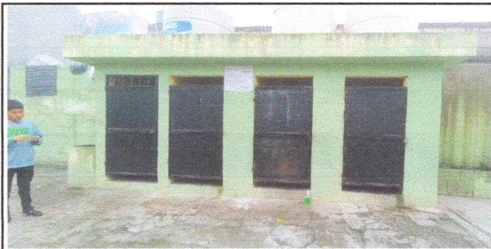
Suministro e instalación de lavamanos