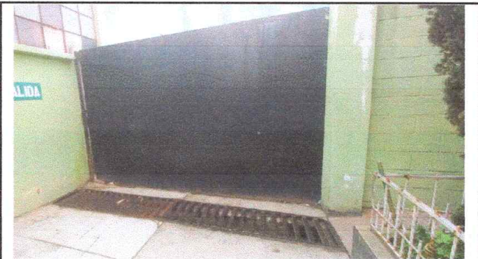
Remozamiento de portón lateral