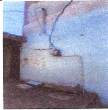
Reparación de muros con impermeabilización, Reparación de conexiones con módulos y bajadas de agua pluvial