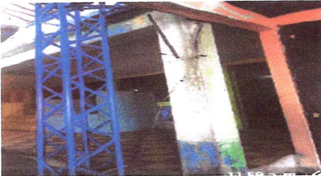
Mantenimiento de sistema eléctrico general