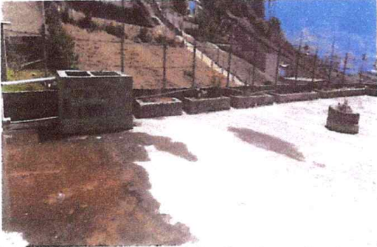
Reparación de muros con impermeabilización, Reparación de conexiones con módulos y bajadas de agua pluvial