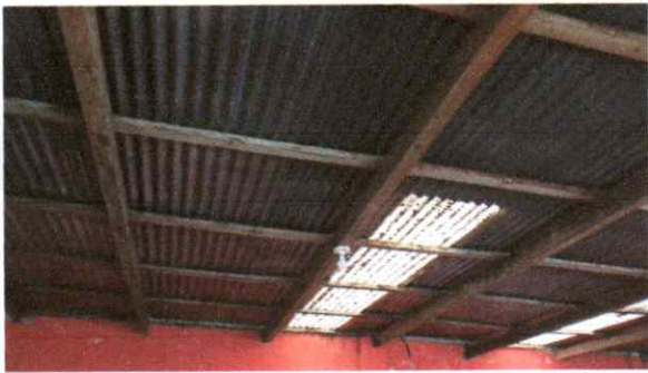
Sustitución de lámina, por lamina acanalada cal. 26.