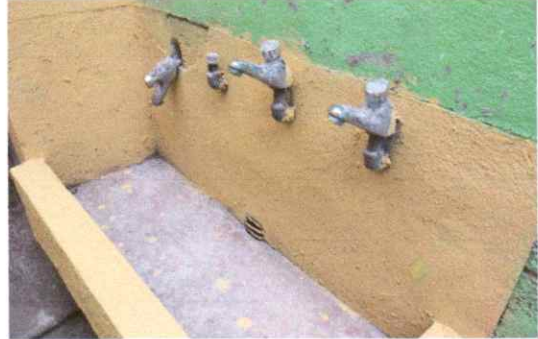
Sustitución de llave de chorro en lavamanos.