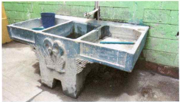
Sustitución de pila prefabricada de concreto de dos alas.

Observación: Si es necesario se pueden agregar hojas adicionales y actualizar el número de hojas.