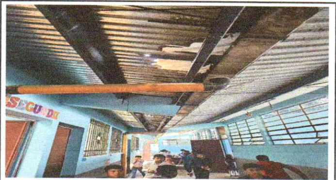
CUBIERTA DE LAMINA EN MAL ESTADO