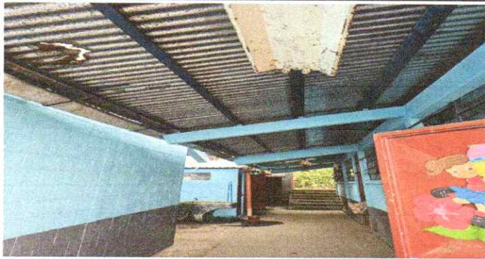
CUBIERTA DE LAMINA EN MAL ESTADO