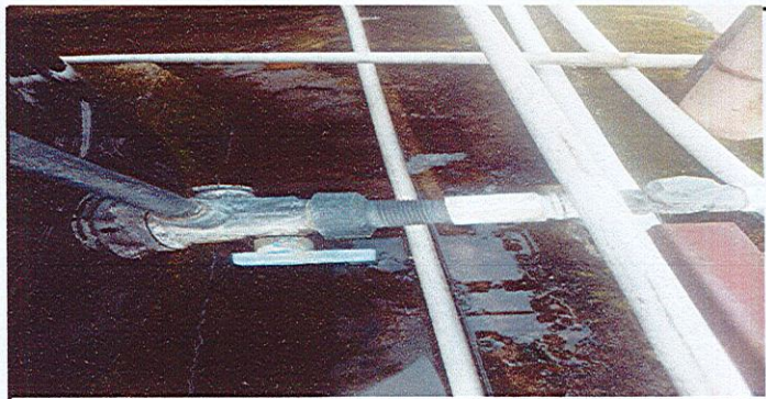
Sustitución accesorios depósitos de agua

Observación: Si es necesario se pueden agregar hojas adicionales y actualizar el número de hojas.