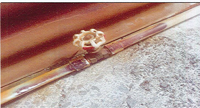
Sustitución de llave de paso