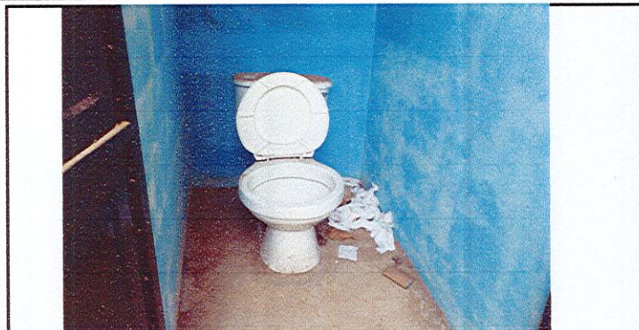
Sustitución de accesorios inodoro (contra llave, tubo de abasto)