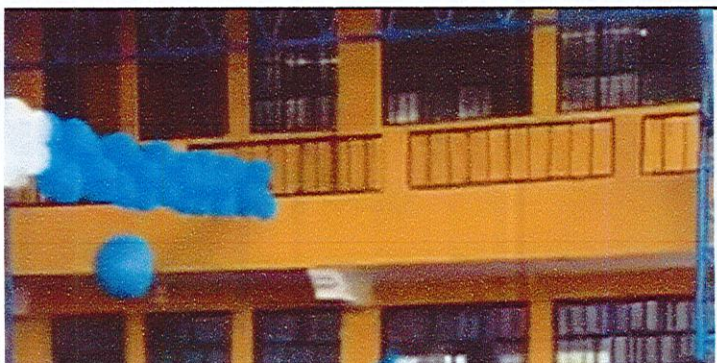
Mantenimiento a barandas de metal en pasillos