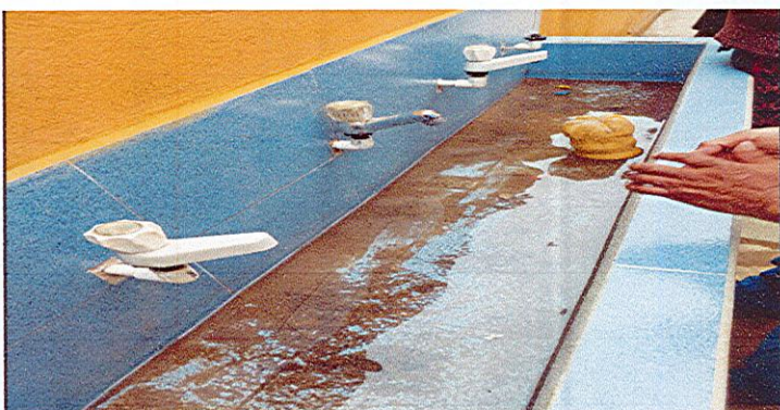
Sustitución de grifos americanos (chorros comunes)