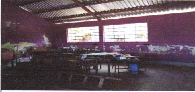
suministro y aplicación de pintura en edificio general