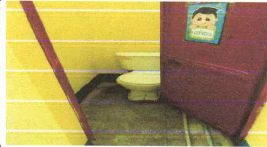
suministro y colocacion de baños aldosa