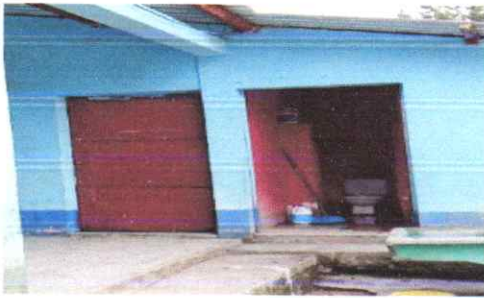
suministro y fabricación de puertas de metal incluye chapa