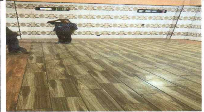
SUMINISTRO Y COLOCACION DE FACHALETA ANTIHUMEDAD