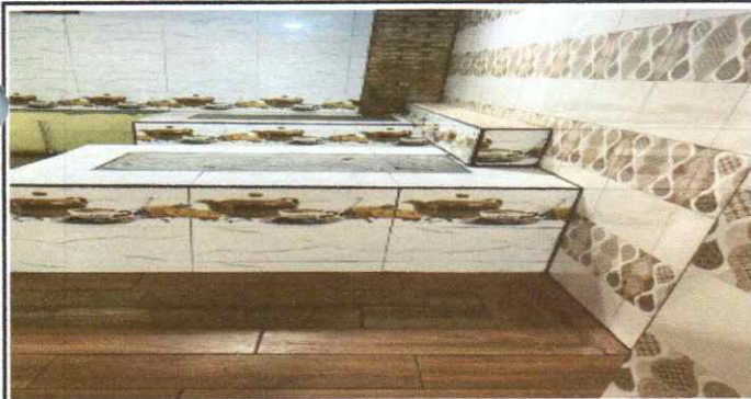
SUMINISTRO Y FABRICACION DE ESTUFA RURAL