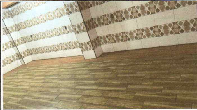
SUMINISTRO Y COLOCACION DE PISO CERAMICO