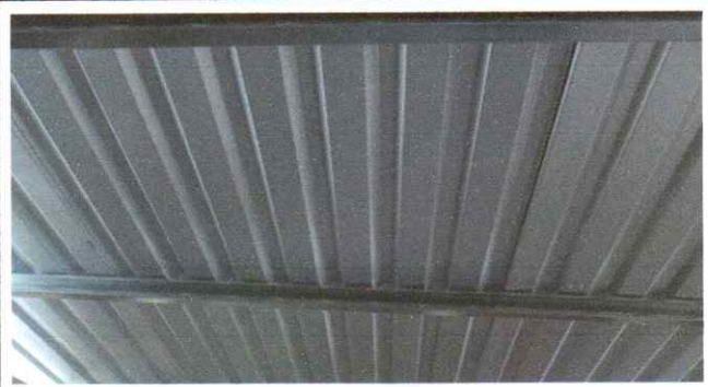
SUMINISTRO Y FABRICACION DE GALERA CON SOPORTE DE METAL