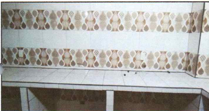
COLOCACION DE SISTEMA DE LUMINARIAS