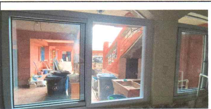
FABRICACION DE VENTAS PVC CON MOSQUIETEROS

Observación: Si es necesario se pueden agregar hojas adicionales y actualizar el número de hojas.