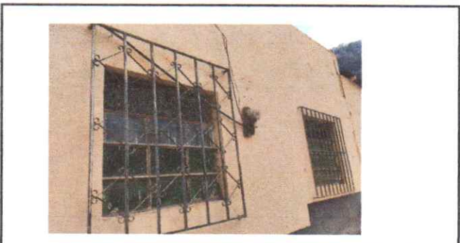
SUSTITUCION DE ESTRUCTURA DE METAL DE VENTANA 6 DIVISIONES CON VIDRIO DE 5 mm 1.00*1.00 Y BALCON 1.00*1.00

Observación: Si es necesario se pueden agregar hojas adicionales y actualizar el número de hojas.