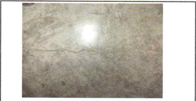
SUMINISTRO E INSTALACION DE PISO CERAMICO ANTIDESLIZANTE ALTO FLUJO