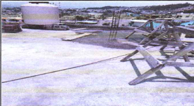
suministro y colocacion de pañuelos en terraza