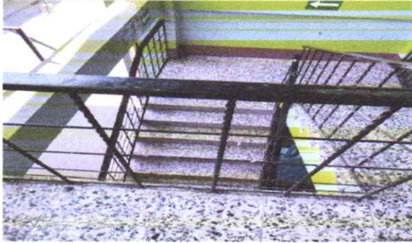
suministro y colocacion de continuacion de block incluye repello