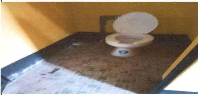
Foto1: Sustitución de inodoros