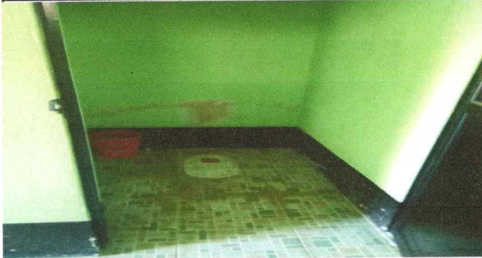
Foto1: Sustitucion de inodoros.