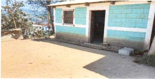
Foto1: ESTADO DE LA COCINA ACTUAL