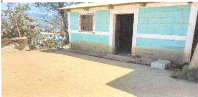
Repello y cernido de muros