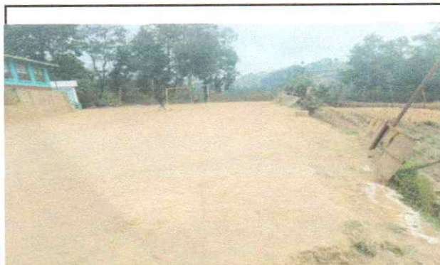
Circulacion de mini campo de futbol con mallas