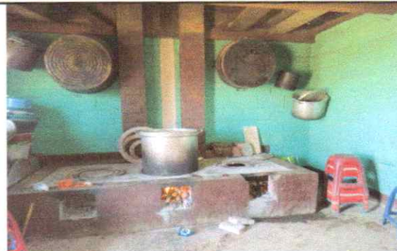
Sumunistro e instalacion pila, gabinetes fijose concretos y planchas de cocina.