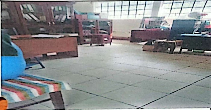
Foto1: Suministro e instalacion de pisos ceramicos aula 1