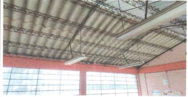
Mantenimiento de estructura portante ,