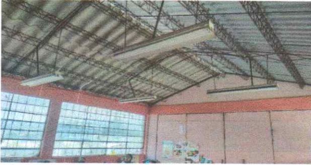
Mantenimiento de estructura portante ,