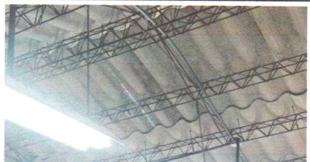
Mantenimiento de estructura portante

Observación: Si es necesario se pueden agregar hojas adicionales y actualizar el número de hojas.