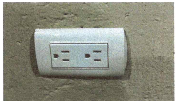
Foto 6: INTERIOR DE LAS AULAS CON SUSTITUCIÓN DE TOMACORRIENTES DOBLE

Observación: Si es necesario se pueden agregar hojas adicionales y actualizar el número de hojas.