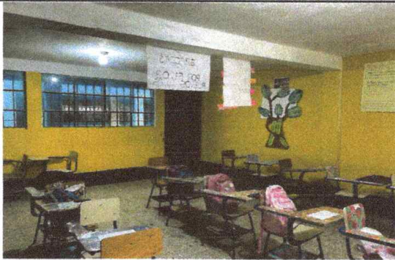
Foto 14: VISTA INTERIOR DE APLICACIÓN DE PINTURA EN AULAS 100% FINALIZADO