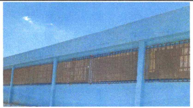
Foto 4: VISTA DE MANTENIMIENTO DE BALCONES (SUJECIONES) 100% FINALIZADO