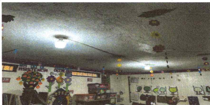
Foto 5: INTERIOR DE LAS AULAS CON SUSTITUCIÓN DE BOMBILLOS LED Y CABLEADO