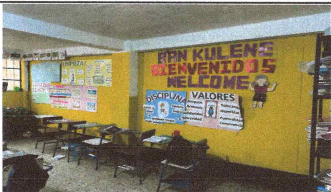
Foto 9: VISTA INTERIOR DE SUSTITUCIÓN DE PARED DE TABLAYESO POR PLAYWOOD 3/4 FINALIZADO.