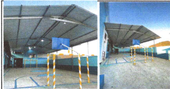
Foto 12: VISTA EXTERIOR DE INSTALACIÓN DE LAMINA TROQUELADA CALIBRE 24 Y ESTRUCTURA PORTANTE DE TECHO.

Observación: Si es necesario se pueden agregar hojas adicionales y actualizar el número de estas hojas.