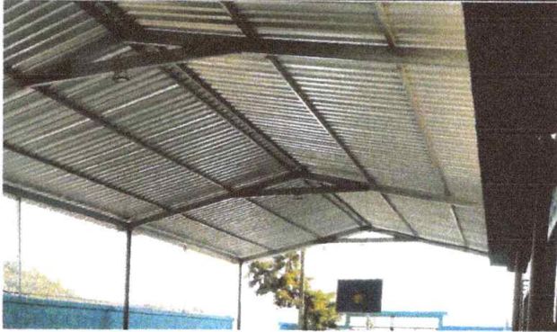
Foto13: VISTA INTERIOR DE INSTALACIÓN DE LAMINA TROQUELADA CALIBRE 24 Y ESTRUCTURA PORTANTE DE TECHO