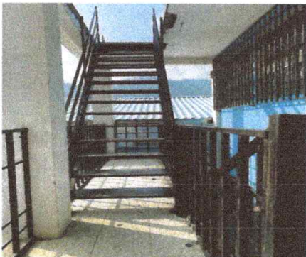
Foto7: VISTA EXTERIOR DE INSTALACION DE GRADA DE METAL 100% FINALIZADO.