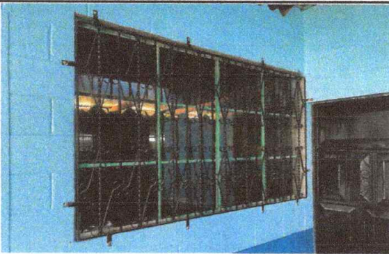
Foto 15: VISTA DE BALCON REPARADO (sujeciones, lijado y aplicación de pintura) 100% FINALIZADA.