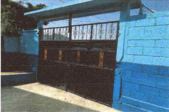
Foto1: VISTA INTERIOR DE MANTENIMIENTO DE PORTON 100% FINALIZADO