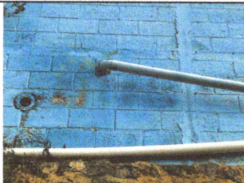
Foto 8: VISTA DE INSTALACIÓN DE TUBERIAS PVC 3" AGUAS NEGRAS, 100% FINALIZADO