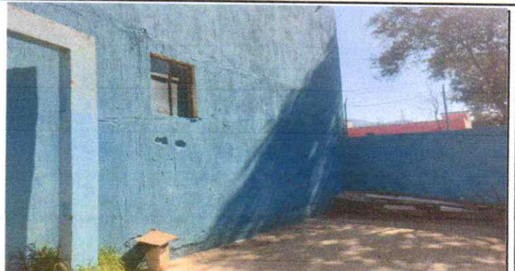
Suministro e instalacion de muro prefabricado