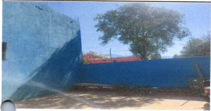
Suministro e instalacion de muro prefabricado