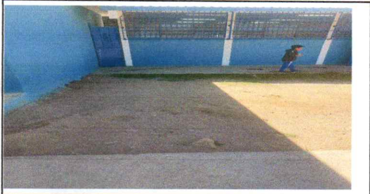
Suministro e instalacion de estructura de techo metalico