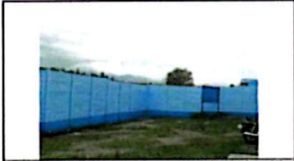
Suministro y aplicación de Pintura de muro perimetral, ambos lados 140 m2