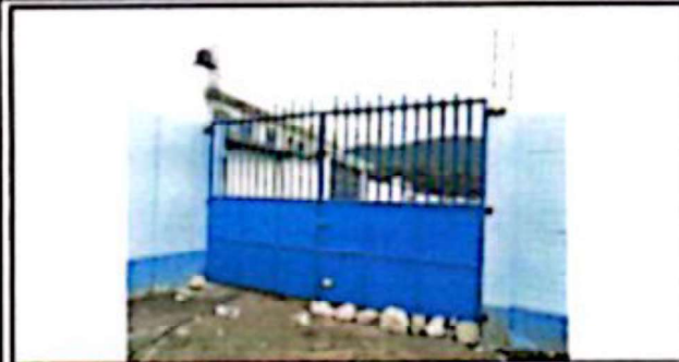
Suministro e instalación de Portón Metálico