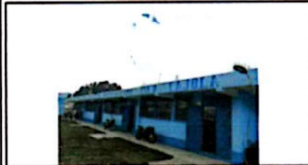
Suministro e instalación de Rótulo de identificación 15m2