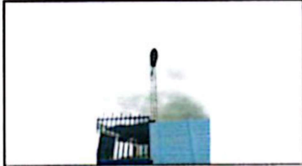
Suministro e instalación de Reflectores con sensor de exterior