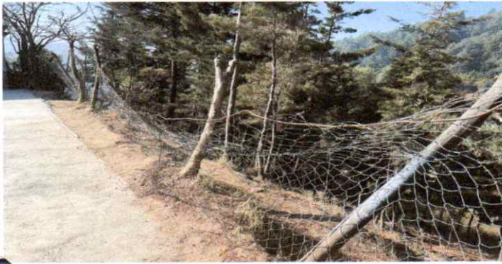
sustitución de muro perimetral columna de mampostería pineada.