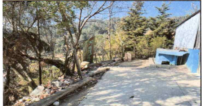
sustitución de muro perimetral columna de mampostería pineada.