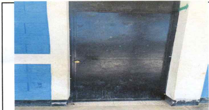
Sustitución de puerta y puerton con maya .