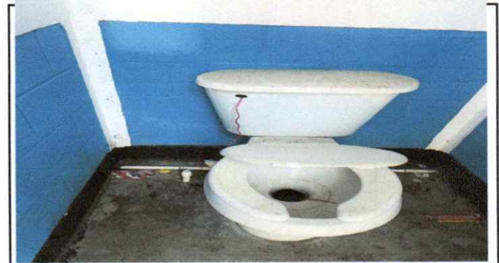
sustitución de accesorios inodoro (contra llave, tubo de abasto)

Observación: Si es necesario se pueden agregar hojas adicionales y actualizar el número de hojas.