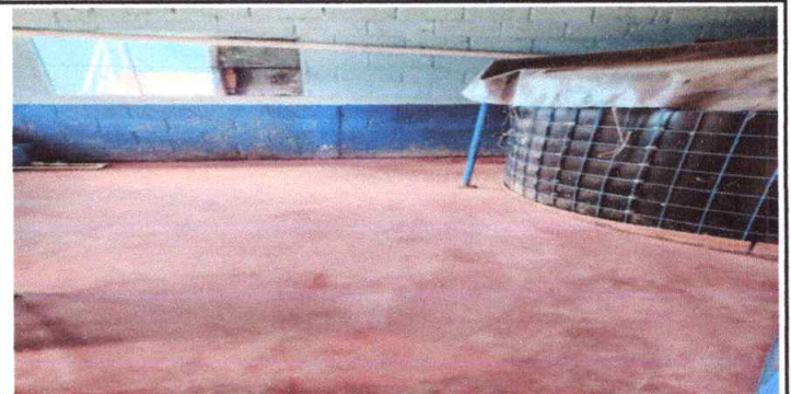
Sustitución de torta de piso alisado