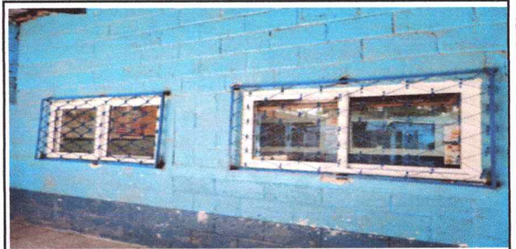
Sustitución de ventanas a PVC