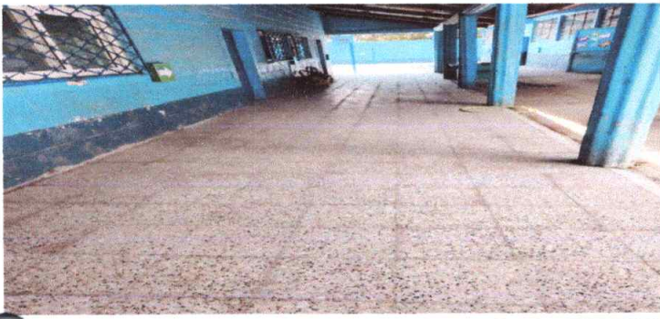
Sustitución de piso a granito de marmol