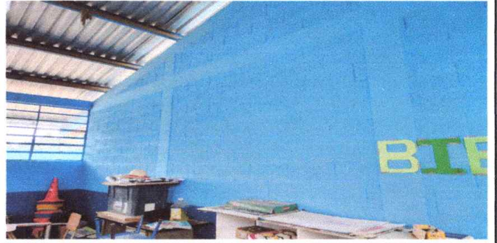
Mantenimiento y aplicación de pintura de 3 aulas