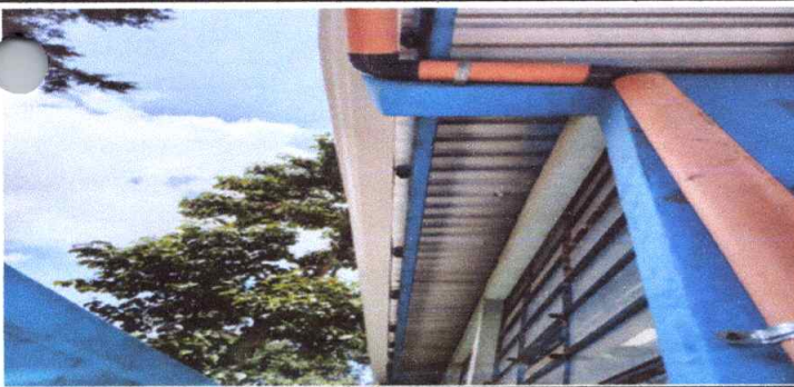
Suministro e instalación de canales de PVC y tubos de 3 pulgadas para caídas