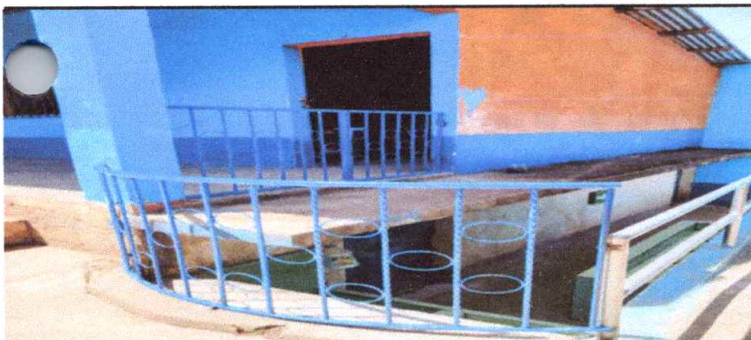
Suministro e instalacion de baranda de metal