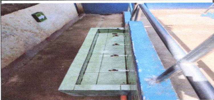
Sustitución de multichorros