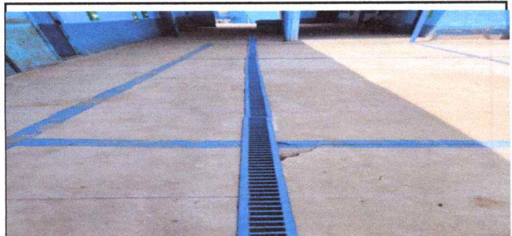
Suministro e instalación de rejilla de metal

Observación: Si es necesario se pueden agregar hojas adicionales y actualizar el número de hojas.