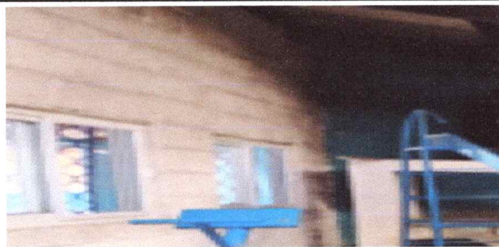
Sustitución de vidrios