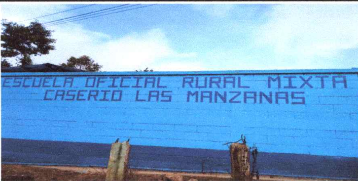
Identificación de la escuela con letras en la pared

Observación: Si es necesario se pueden agregar hojas adicionales y actualizar el número de hojas.