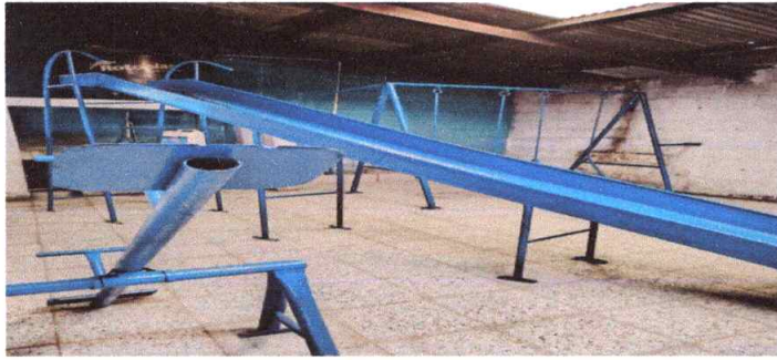
Mantenimiento de juegos infantiles