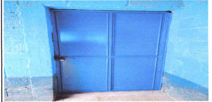
Mantenimiento y pintura de puertas