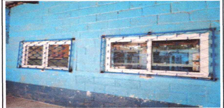
Mantenimiento de balcones