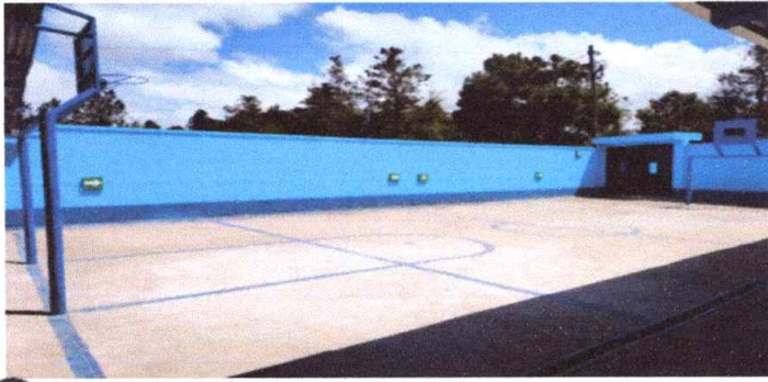
Sustitución de porterías y tableros