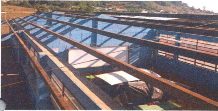
Foto1: Retiro de láminas Antiguas