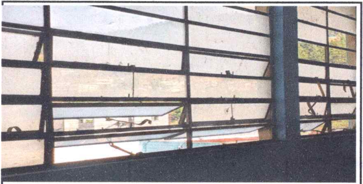
Foto 6: Anulado y Sellado de Balcones, Sustitución Vidrios, Anulación de Pasadores

Observación: Si es necesario se pueden agregar hojas adicionales y actualizar el número de hojas.