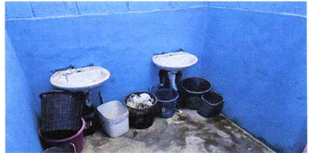
Sustitucion de lavamanos

Observación: Si es necesario se pueden agregar hojas adicionales y actualizar el número de hojas.