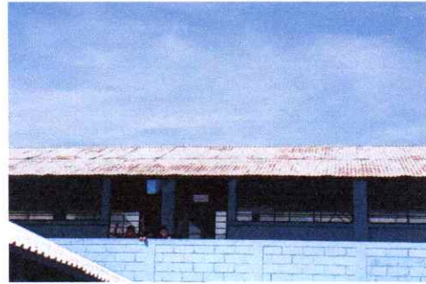
Sustitucion de lamina acanalada por lamina troquelada calibre 26